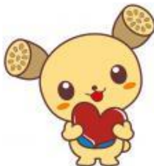
土浦市イメージキャラクター つちまる