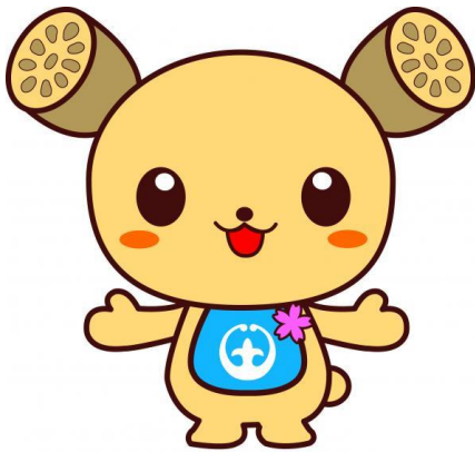
土浦市イメージキャラクター つちまる

名前：つちまる 性別：男の子 年齢：永遠に1歳6ヶ月 趣味：各地のイベントめぐり 好きな食べ物：カレー、常陸秋そば お気に入り：スタイのコーディネート チャームポイント： つぶらな瞳とよちよち歩き