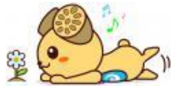
土浦市イメージキャラクター つちまる