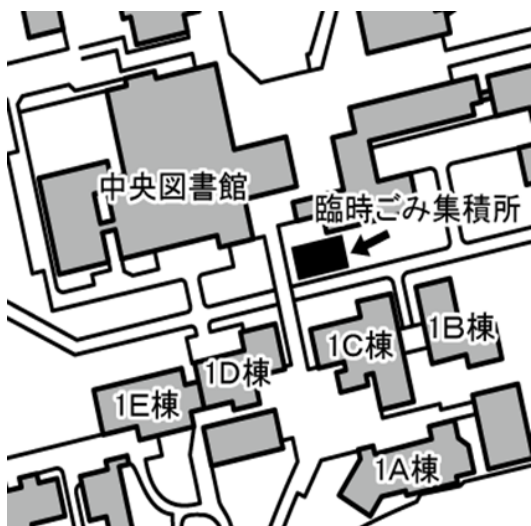
図 1 変更前