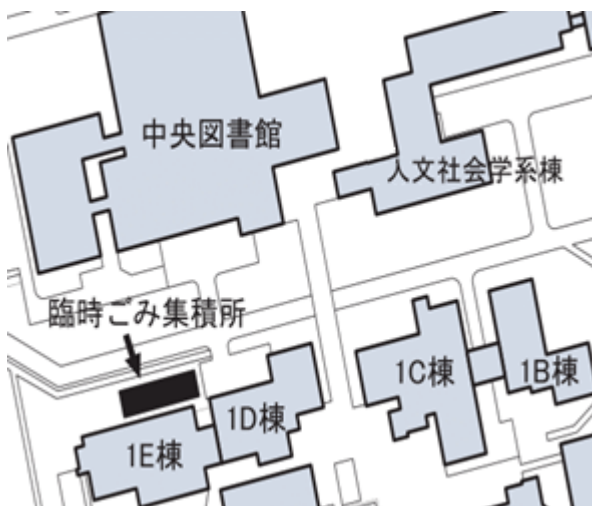
図 2 変更後